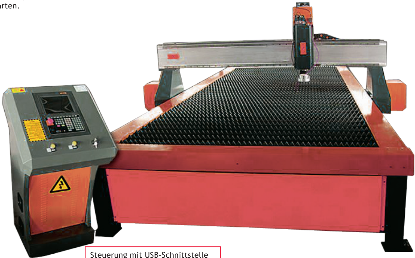
Steuerung mit USB-Schnittstelle

Robuste Stahlkonstruktion für hohe Verfahrgeschwindigkeiten und ein sauberes Schnittbild (kein Autogenschneiden möglich). Die Anlage ist einfach zu installieren und ebenso einfach zu warten.